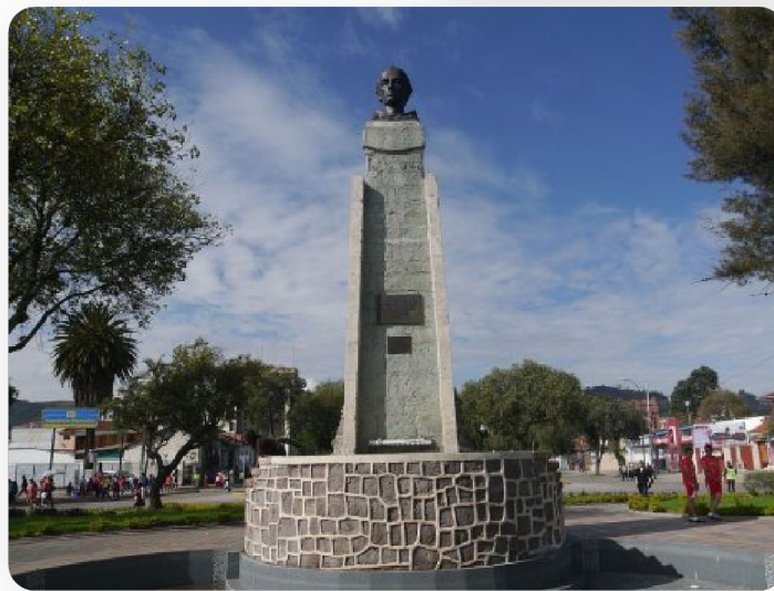
Monument à la mémoire de Frère Vicente Solano - Cuenca